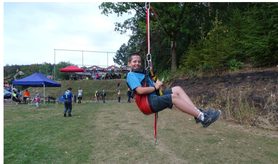
Rozloučení s prázdninami – připravená lanovka pro děti.