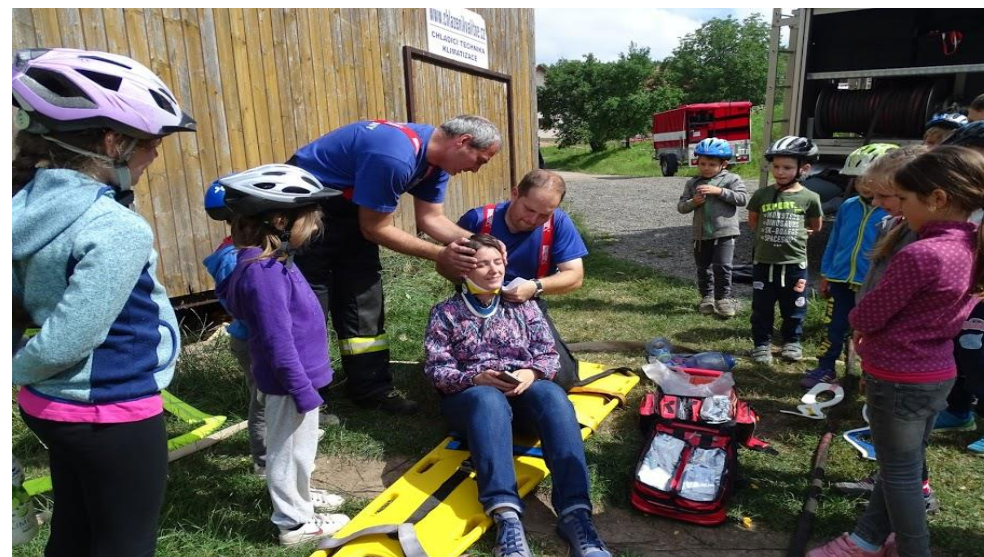
PVČ: Ukázka prvotního ošetření zraněného při akci Zakončení školního roku pro ZŠ Jabloňany a MŠ Obora