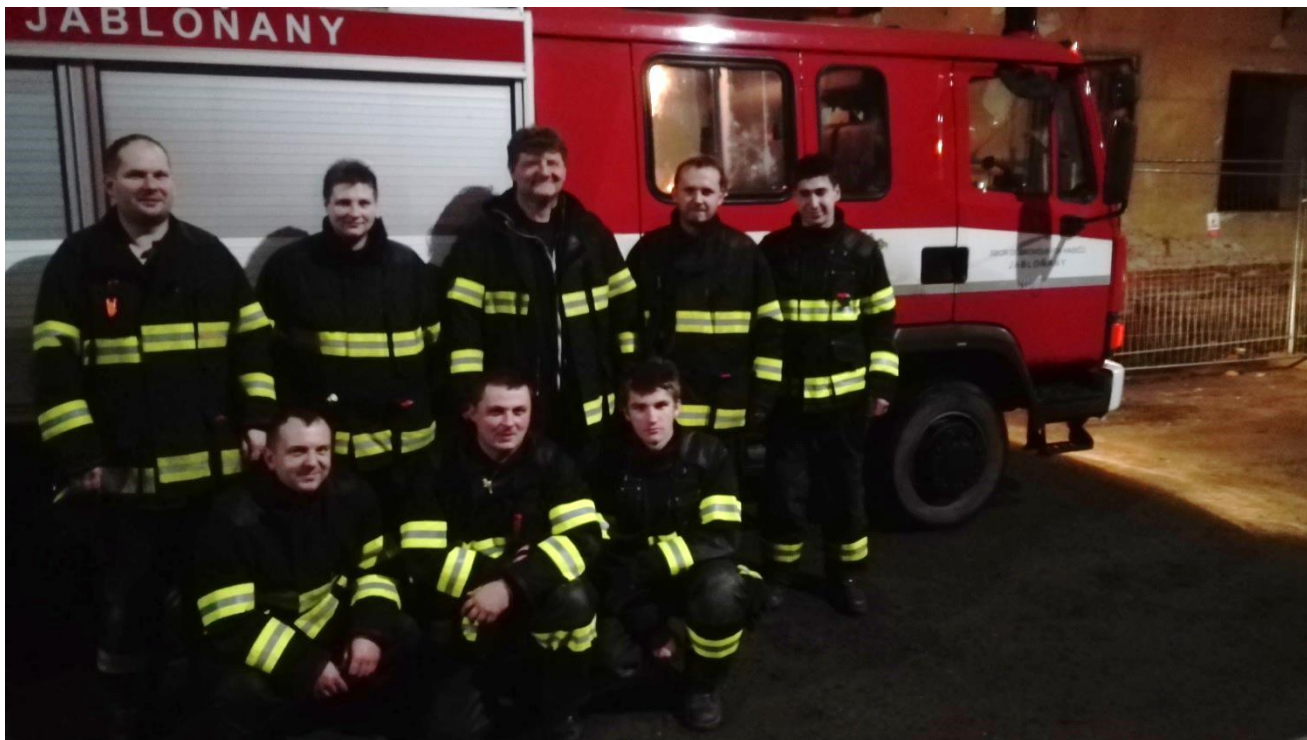
Fotografie: Účastníci večerního a nočního výcviku IMZ pro JSHD z okresu BK v Tišnově, prosinec 2018.