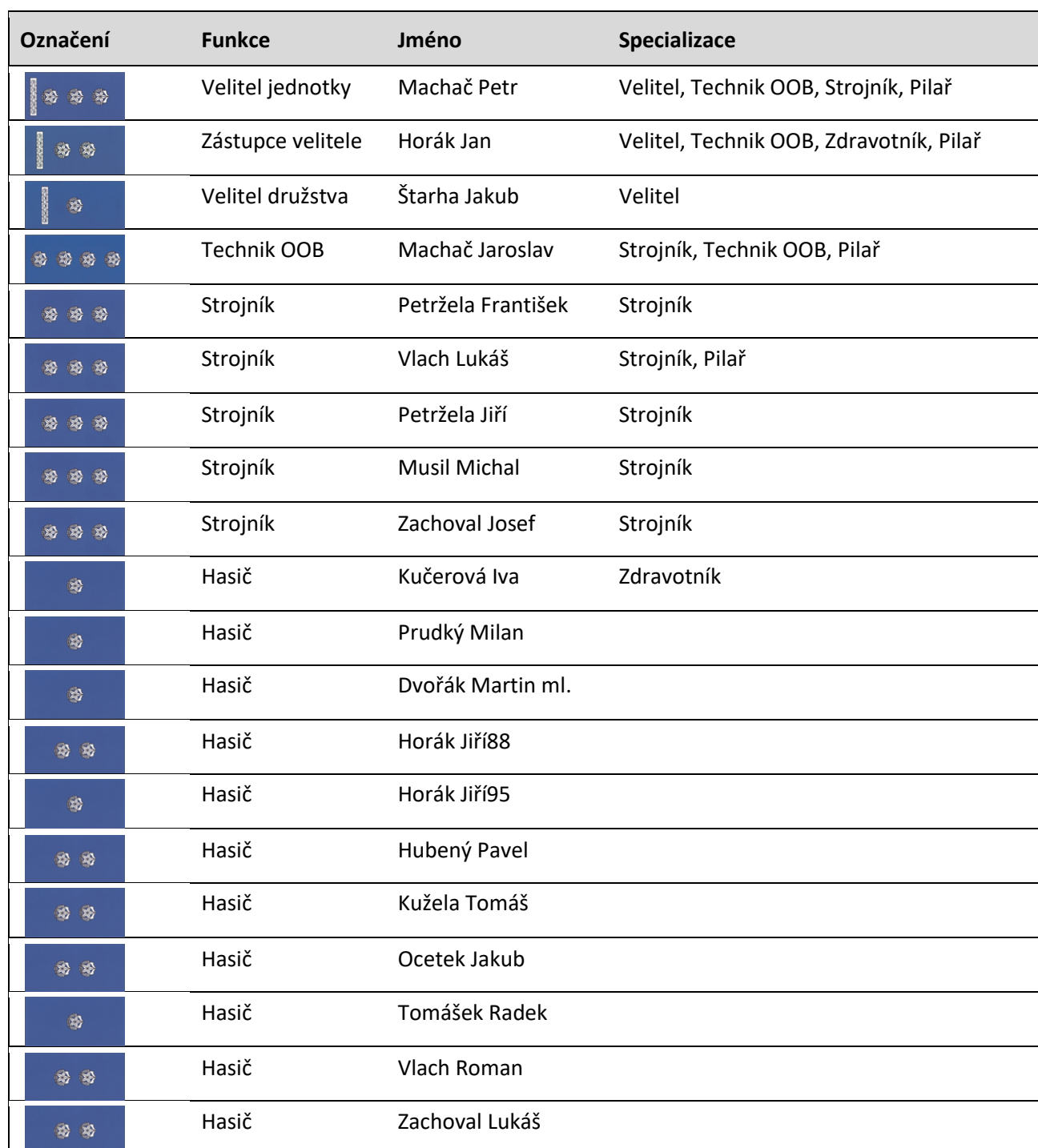
Tabulka: Seznam členů JSDH Jabloňany

U JSDH Jabloňany se jedná o jednotku s místní působností, která zpravidla zasahuje na území svého zřizovatele, obce Jabloňany, s povinností výjezdu do 10 minut. Svolání jednotky je prováděno pomocí SMS a AMDS voláním některým členů na mobilní telefon. Jednotný dálkově řízený způsob svolávání pomocí rotační sirény prostřednictvím KOPIS HZS JMK není v Jabloňanech zřízen.