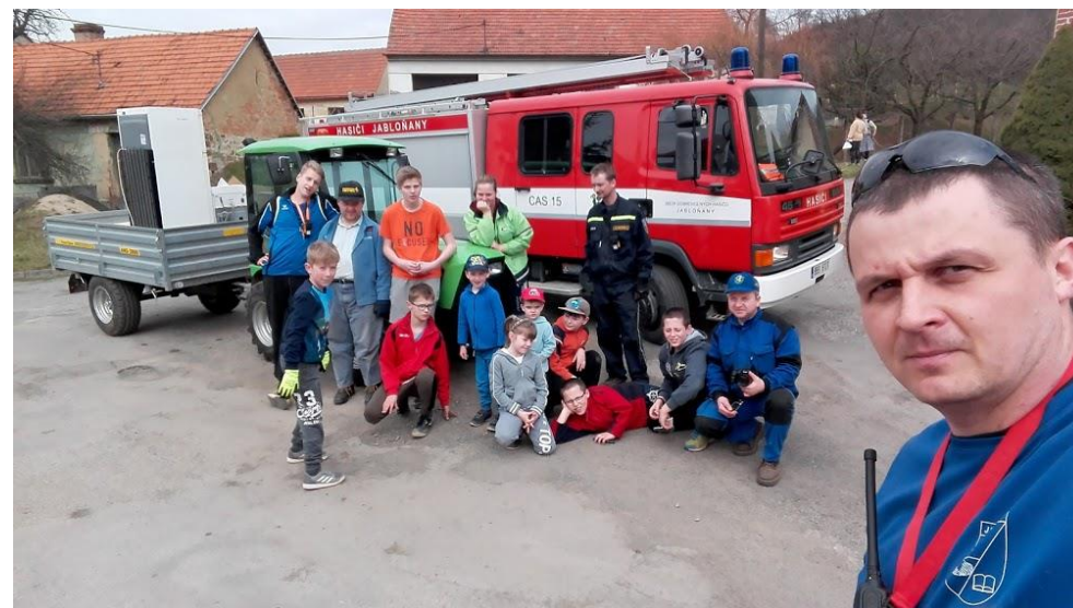
Spolupráce JSDH s MH při sběru elektroodpadu a starého papíru