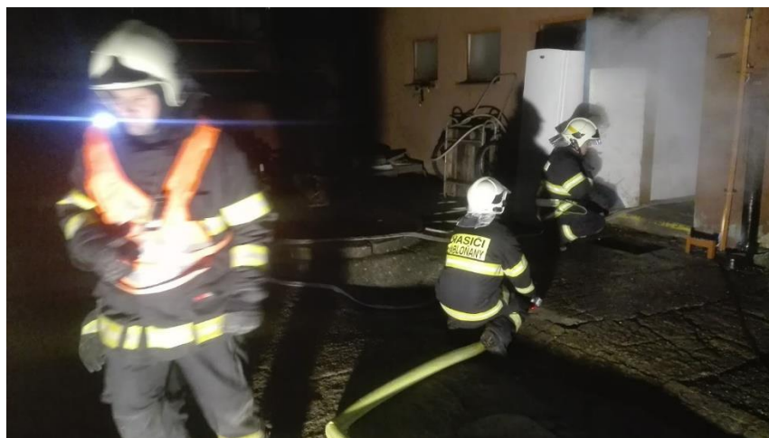
Fotografie z IMZ (výcviku) JSDH okresu Blansko ve školícím zařízení Tišnov: stanoviště vstup a hašení v zakouřených prostorech, prosince 2018.