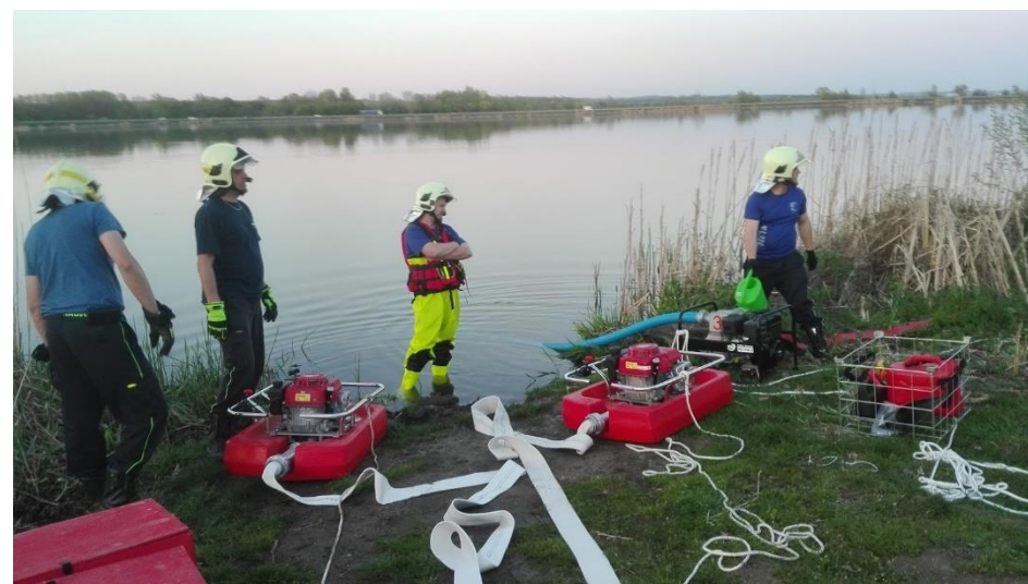
Výcvik – IMZ OOB Pasohlávky: práce s „suchých“ oblecích, duben 2018.