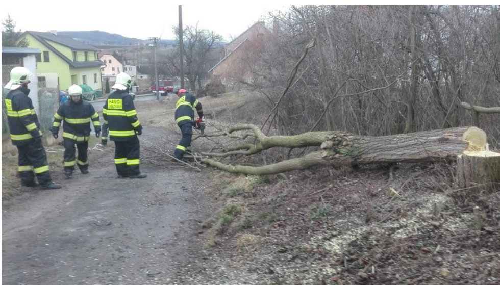
Činnost pro obec – kácení dřevin v dolní části obce.