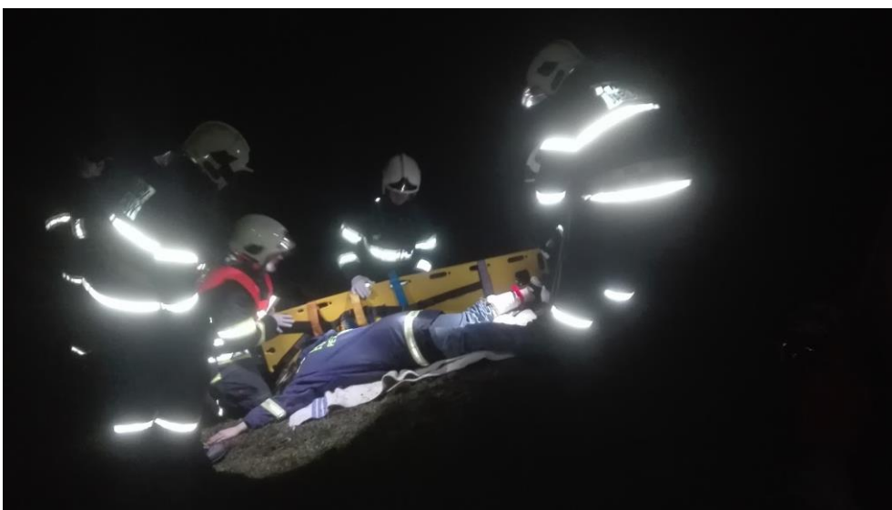
Výcvik – IMZ pro JSDH z okresu Blansko v Tišnově, prosinec 2018.