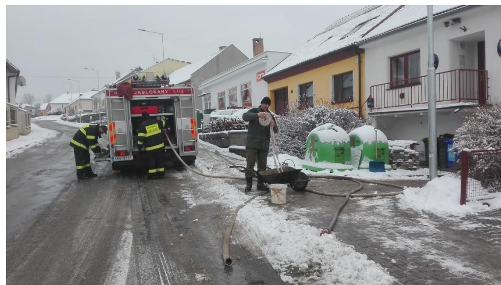
Činnost pro obec čištění ucpané kanalizace pod OU v rámci stavebních úprav vjezdu.