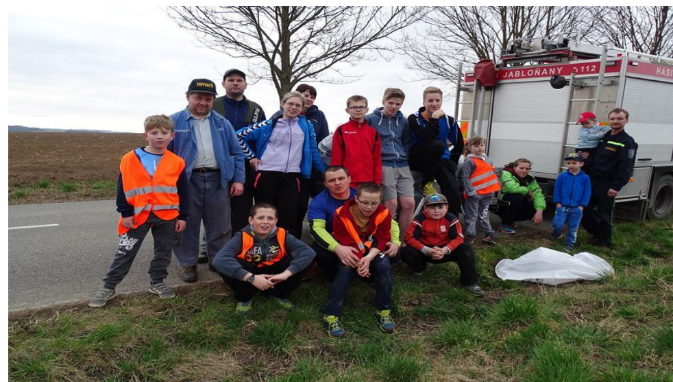
Zapojení techniky JSDH do akce: Úklidíme česko. Uklidíme si doma, Jabloňany