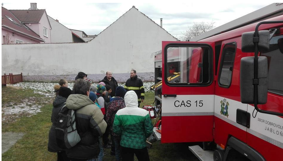
PVČ: Návštěva dětí ze studijního střediska Oblastního spolku ČČK Blansko.

https://photos.google.com/share/AF1QipPyT8H8dvuy4e-OBEfsHq70SC18OLAWVwVi2FloCtLwJKe7kbbQKXDEoF1-RUmwg?key=LXdmeVFHOXJ4VUpDa3FFZE9Lb0pEV1QzZXB0dVI3