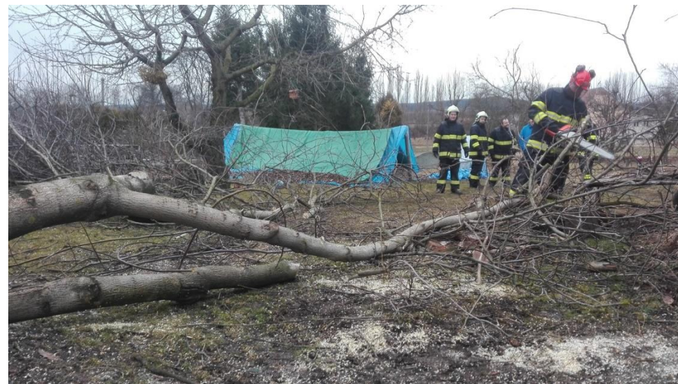
Činnost pro občana – březen 2018 kácení dřevin v dolní části obce.