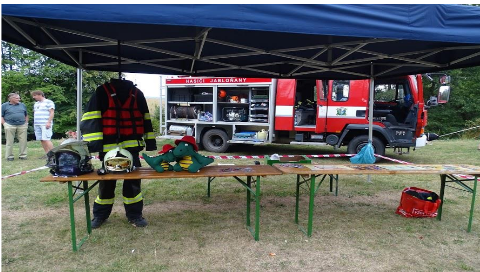
PVČ: Ukázka techniky a vybavení při akci rozloučení s prázdninami v Jabloňanech.