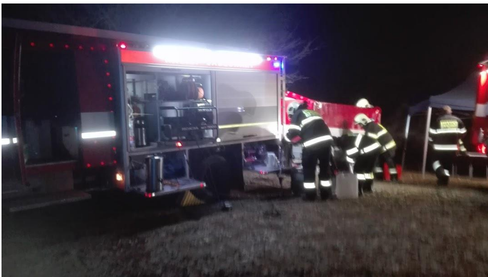
Zřízení týlového zázemí při požáru 30. 11. 2018 v k.ú. Lhota Rapotina.