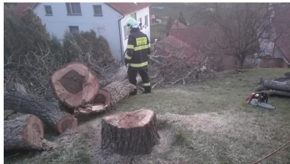
Činnost pro občana – listopad 2018 kácení dřevin v horní části obce.